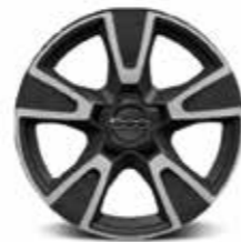
17" lichtmetalen velgen