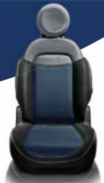
Stoffen stoelen zwart met blauw