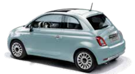
VERDE RUGIADA - 5CD/196